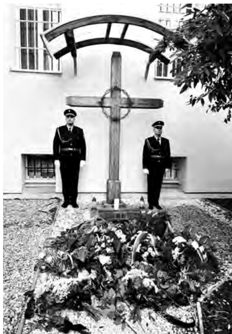
↑ Místo bývalého popraviště, věznice Praha Pankrác